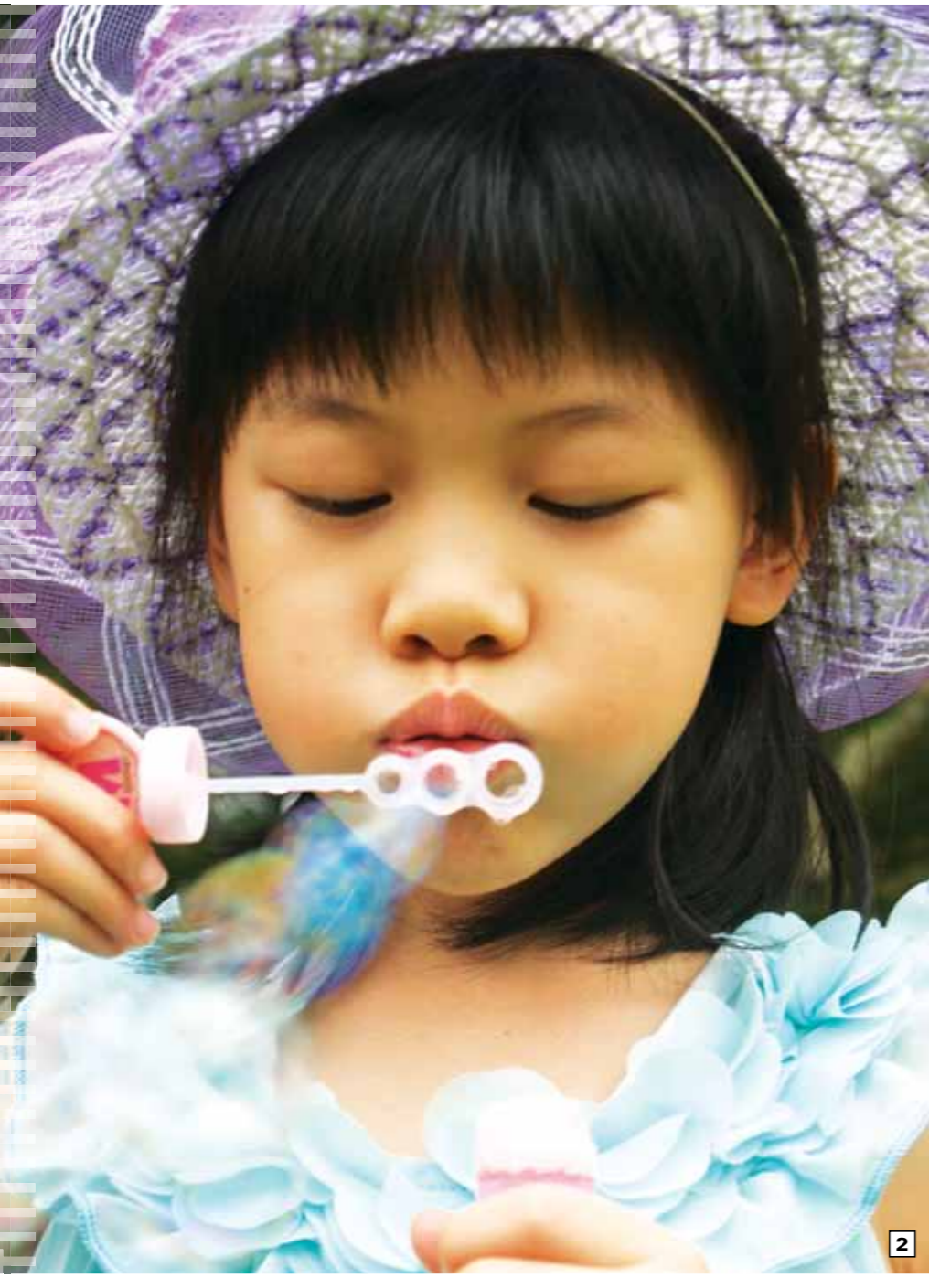
1. קו הרקיע של העיר טייפה, אחת הערים האסייניות התוססות, הן בשעות היום והן בלילות. צפיפות האוכלוסייה בעיר מקדמת מיזמים של בנייה לגובה. 2. פסטיבל הזיקוקים באי פאנגו הוא הזדמנות מצוינת למבוגרים ולילדים ליהנות מהפנינג באווירה מהנה ומשחררת.

האמת, המדינה המרתקת הזאת, טייוואן (Taiwan), שווה וואו! אמנם לא מדובר באחת המדינות שמוצפות בתיירים ישראלים הרוצים לטייל במזרח, אבל ההפסד כולו שלנו. הגעתי לכאן לאחר שהחלטתי לבדוק מעט יותר לעומק את אפשרויות הטיול במדינת האיים השוכנת באוקיינוס השקט, באזור מזרח אסיה.