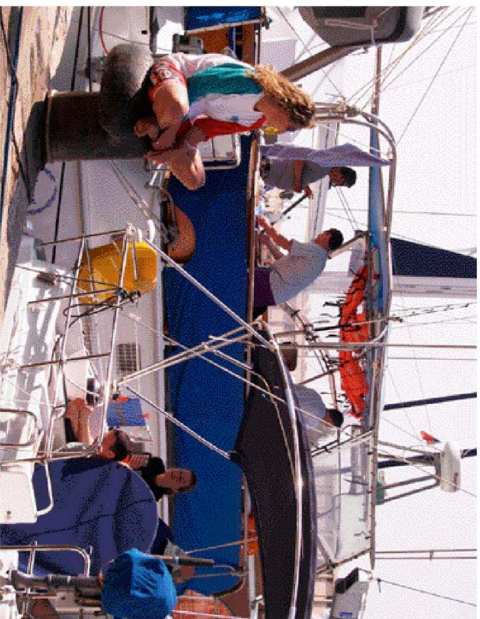
1. ארחת מרתון אירוסה וקרוקלינג בוארד דורוה היורד מוסרת גליף בכפר צפונה.