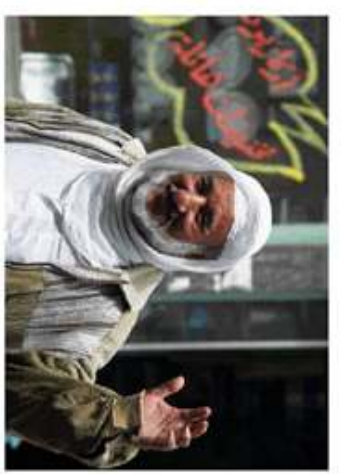
2. בדרך ששעברת ירי הגבול המצרי-לובי ניקי בכר כצומת פוקוסים מאוחר יותר מהרועה מידת פיקוד כיכר צומת