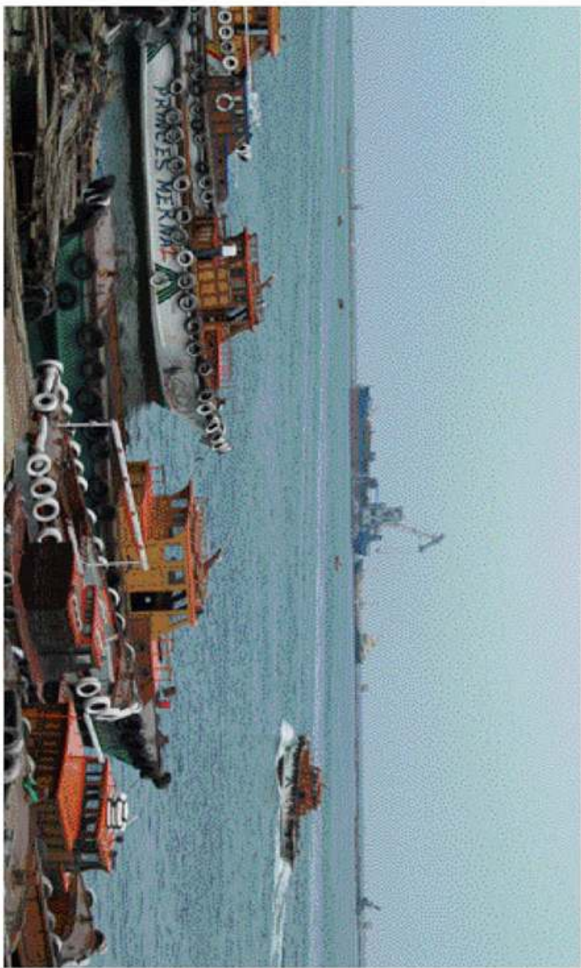
1. איתור חסות שיחמם פוקוסים מאוחר יותר מהרועה מידת פיקוד כיכר צומת

על אף שישנה תמיכה רחבת היקף בפרוטוקול, אין זה אומר שישנה תמיכה מלאה בהחלטתו. ישנן כוחות המונים במדינה המעדיפים את הממשלה הנוכחית, אך ישנן גם כוחות המעדיפים את הממשלה הקודמת. ישנן גם כוחות המעדיפים את הממשלה החדשה, אך ישנן גם כוחות המעדיפים את הממשלה הקודמת. ישנן גם כוחות המעדיפים את הממשלה החדשה, אך ישנן גם כוחות המעדיפים את הממשלה הקודמת.