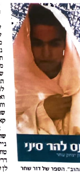
נס להר סיני הסבר של דור שחר