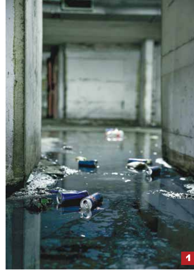
1 אז בוא ונצלול קצת להיסטוריה. בסופו של דבר, במרחק של כקילומטר משם הייתה התחנה המרכזית הישנה בתל אביב, שעבדה. בשביל מה היה צריך להקים את גוש הבטון העצום הזה?

אנחנו מדברים על תחילת שנות ה-60 כשמתקבלת ההחלטה להקים תחנה חדשה. היה צורך בשדרוג המקום וביצירת מקום חדש יותר, מקום סגור, לעומת התחנה הישנה שהייתה פתוחה ברחוב. זו התשובה ההגיגית. אבל למה בחרו להקים את התחנה המרכזית הכי גדולה בעולם דאז, שכיום היא במקום השני בגודלה לאחר התחנה המרכזית בהודו? זו באמת תעלומה.