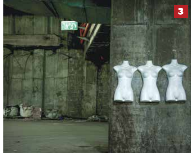
3 בתוך התחנה מרגישים שהמסדרונות בהם כמו רחובות גדולים מאוד, שמקבלים תאורה מבחוץ דרך חלונות זכוכית, ועם חנויות לאורך כל הדרך.

בקומה אחת יש רציפים עם שרוולים שמיועדים לאוטובוסים, ושם מקננים עטלפים. בעבר אפילו פעלה במקום כיתת מחקר מטעם האוניברסיטה. חצי קומה מעל יש אולם קולנוע שפעל תקופה מסוימת, ואחרי כן הפך לאולם של ה"קאמל קומדי קלאב". קיים שם גם "מקלט השמועות", כפי שאני קורא לו. עד היום לא הצלחתי לשמוע מידע מהימן עליו. טוענים שהוא נגד לוחמה כימית וכדומה. ושאלת השאלות: בידי מי מצוי המפתח למקלט הזה ומי רשאי להיכנס אליו בשעת הצורך... בקומות הללו, נכון להיום, יש כמה חנויות, חדרים של צוותי הניקיון, וכן הן מהוות חלל מחסנים עבור בעלי החנויות מהקומות העליונות. במשך כמה שנים פעל שם תיאטרון מסתורין נודד, שנדד יחד עם הקהל בתוך רחבי התחנה.