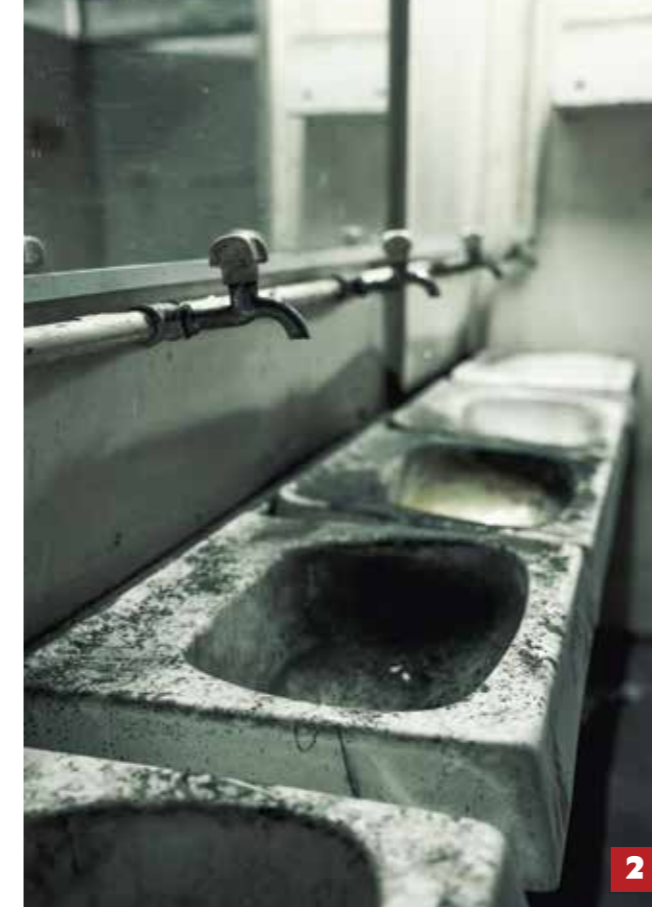
2 של התחנה המרכזית עד היום. התחנה עצמה נפתחה בפועל בתחילת שנות ה-90, ומעניין לדעת אם גורלה היה שונה אם הפתיחה הייתה מוקדמת, ללא השנים שבהן היא עמדה ריקה.

ויש סיפורים ספציפיים שהגעת אליהם? אני מכיר שישה מקרים של התאבדות של ראשי משפחות עקב בעיות כלכליות. אני מאמין שיש עוד סיפורים קשים סביב הדבר הזה. זה מה שקורה שהחלטה ניהולית בדרג גבוה מביאה לקביעת גורלות של אנשים.