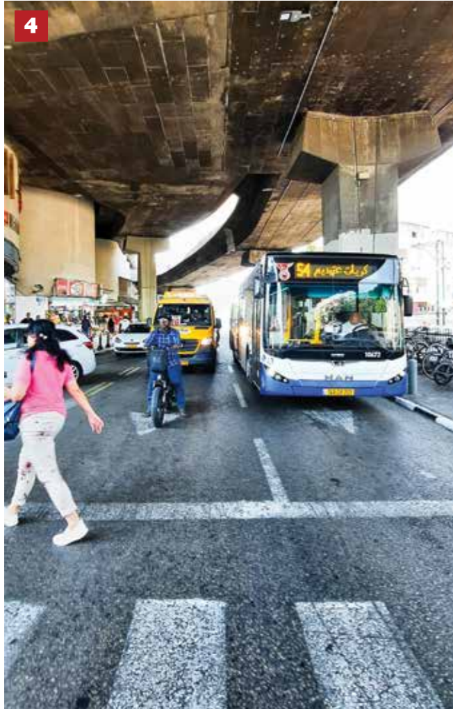
4 ספר לי קצת על הקומות באופן כללי - מלמטה ועד למעלה.

אל הקומות התחתונות ניתן להיכנס רק בסיור מודרך, וגם לא תמיד, כי הרבה פעמים חברת הניהול מסלקת אותנו משם בטענה שהקומות הללו מסוכנות. למעשה, הסכנה שם זהה גם לשאר חלקי התחנה המרכזית, כי פשוט אין אישור כיבוי אש לתחנה המרכזית. אבל, נראה לי שפשוט התחיל גל של סיורים בתחנה וזה לא היה נוח לחברת הניהול.