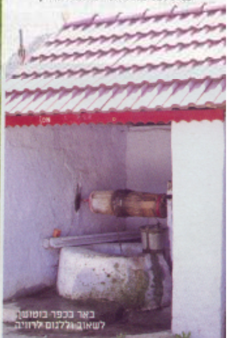
באר בכפר בוטושן לשאוב וללנוס לרזניה

מולדובה עמרי גלפרין