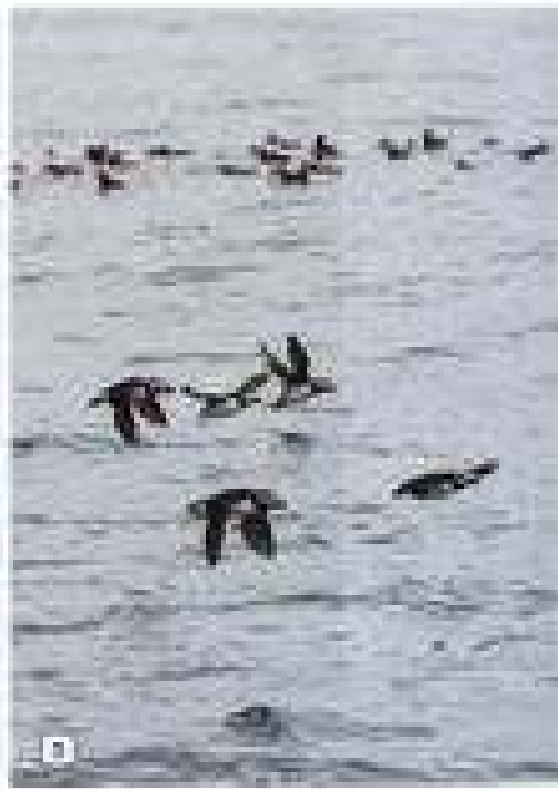
1. A white seagull in flight. 2. A group of seagulls on a wooden deck. 3. A large flock of seagulls on a body of water.