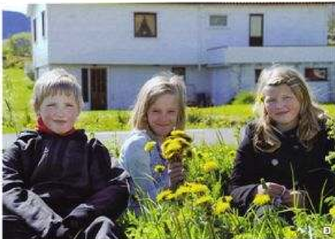
2019年5月，在挪威的松恩峡湾，三名孩子在一片黄色的花丛中玩耍。背景是一座白色的建筑。