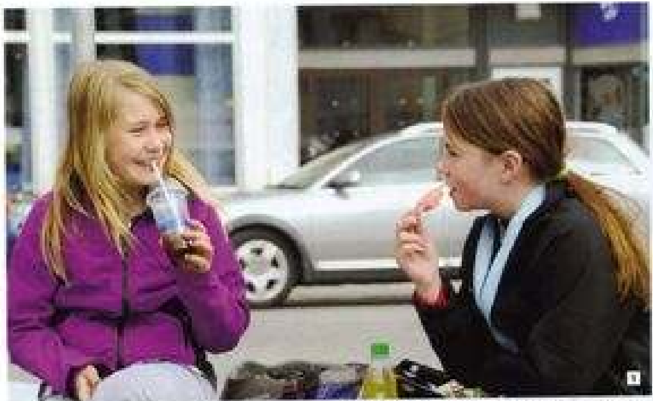
1. שתי בנות צעירות יושבות ליד שולחן אוכלים ומדברות. 2. שתי בנות צעירות יושבות ליד שולחן אוכלים ומדברות. 3. שתי בנות צעירות יושבות ליד שולחן אוכלים ומדברות.

על חלקי החימום שיש במבנה זה, והוא לא ייתכן שיש בו חלקי חימום. זהו חלק מהמערכת המבנית של המבנה, והוא לא ייתכן שיש בו חלקי חימום.