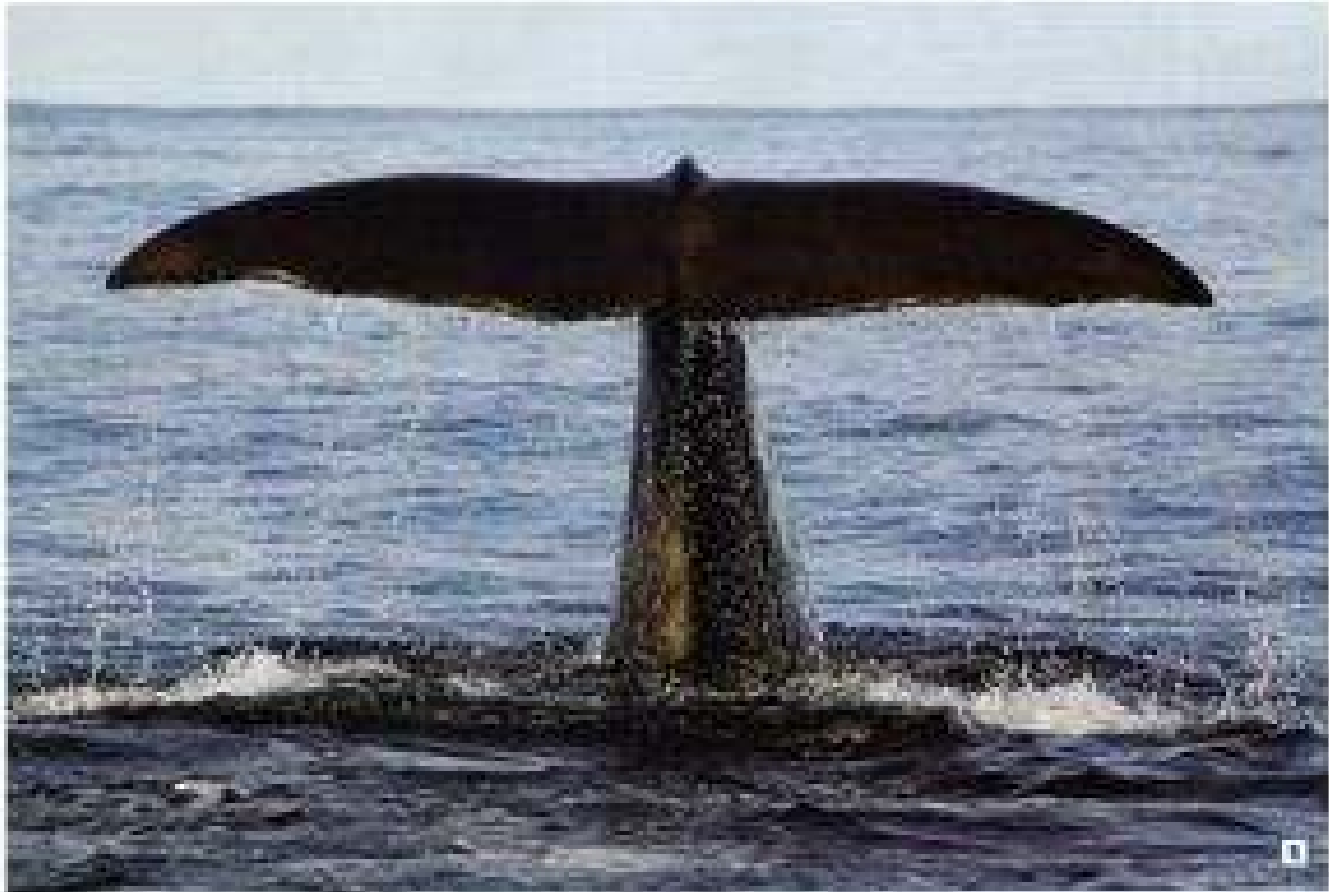
1. A large whale breaching the ocean surface, showing its massive pectoral fins and a thick, tapered tail column.