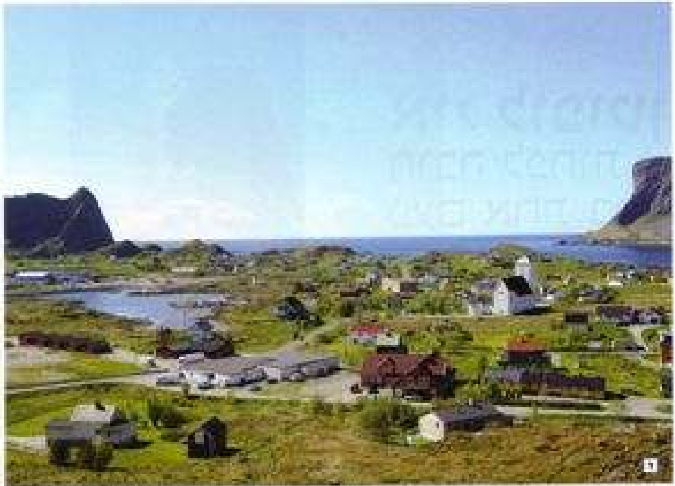
1. תמונה של חבל לנדאקווי, שבמערב איסלנד. חבל לנדאקווי הוא חבל גידול חקלאי חשוב, ובו נמצאים חבלים רבים, כולל חבל לנדאקווי. חבל לנדאקווי הוא חבל גידול חקלאי חשוב, ובו נמצאים חבלים רבים, כולל חבל לנדאקווי.

התחום העשיר ביותר באיסלנד, והוא מיושב על ידי כ-100,000 תושבים, ובו נמצאים חבלים רבים, כולל חבל לנדאקווי.