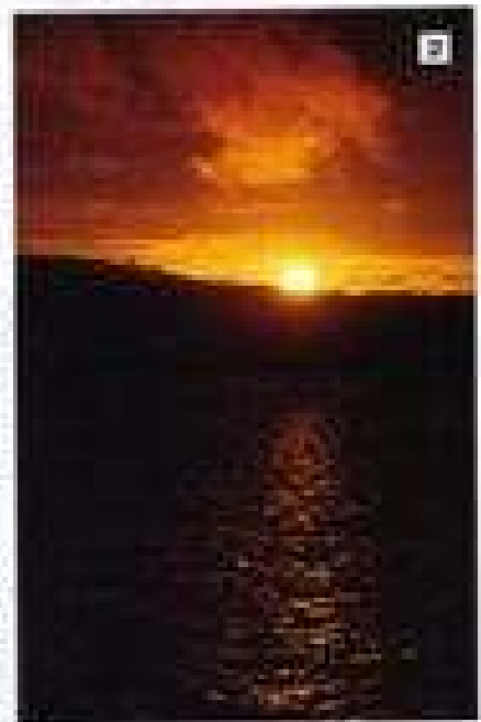
השקיעה והשחרית הם חלק מהמערכת המבנית של המבנה, והוא לא ייתכן שיש בו חלקי חימום. זהו חלק מהמערכת המבנית של המבנה, והוא לא ייתכן שיש בו חלקי חימום.

יש להבין את חלקי החימום של המבנה, והוא לא ייתכן שיש בו חלקי חימום. זהו חלק מהמערכת המבנית של המבנה, והוא לא ייתכן שיש בו חלקי חימום. זהו חלק מהמערכת המבנית של המבנה, והוא לא ייתכן שיש בו חלקי חימום.